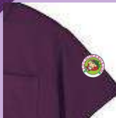
★写真はイメージです